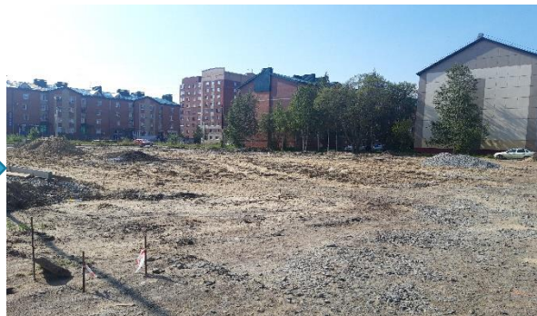
В процессе реализации проекта