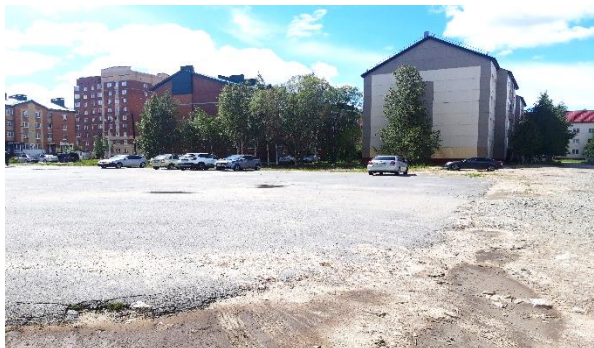
До реализации проекта